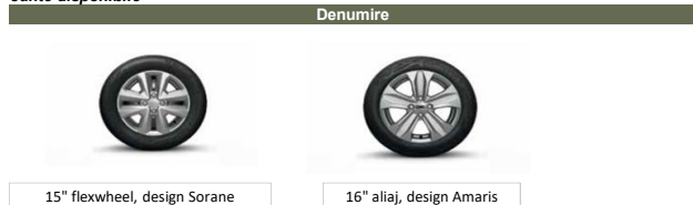
15" flexwheel, design Sorane