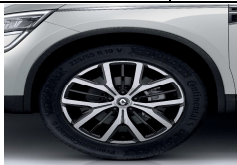
Jante de aliaj de 19" design Biton